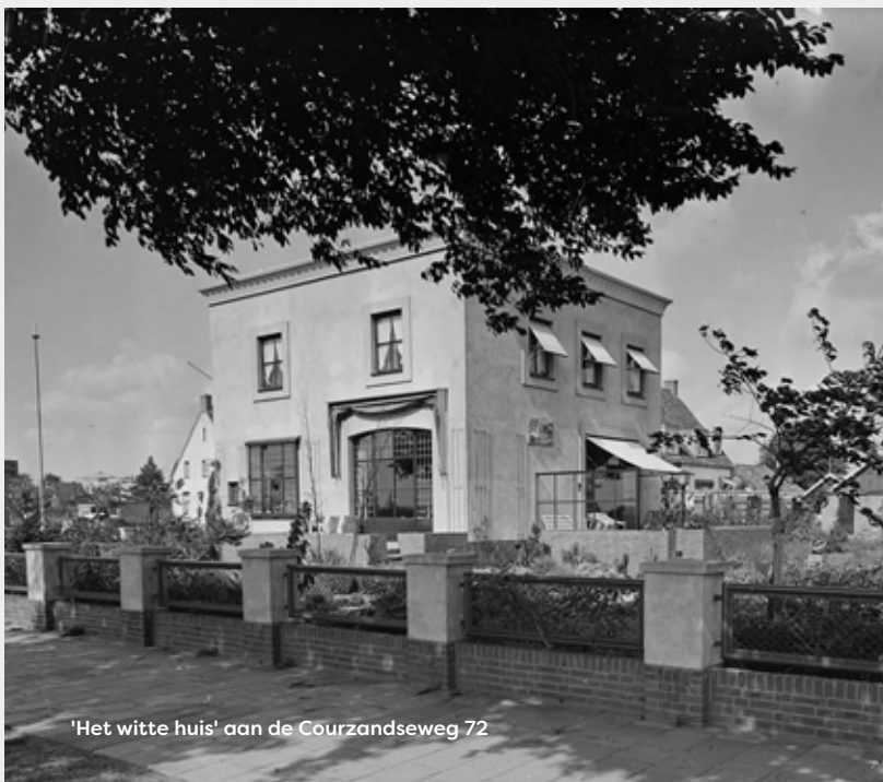
'Het witte huis' aan de Courzandseweg 72